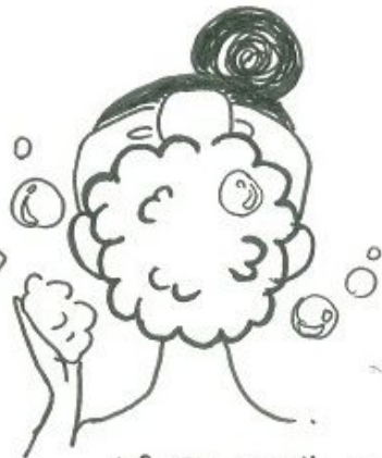
ヒュアコラーゲン1000の 泡をたっぷりとお顔にのせてください。