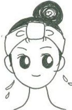
水、ぬるま湯で 20回くらい流してネ！ *タオルで軽く水気を とりましょ。